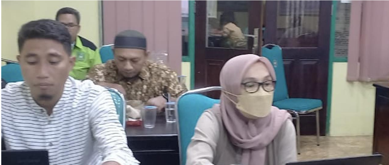
Gambar 4. Peserta sedang mempraktekkan materi yang sudah diberikan

Pelaksanaan pelatihan ini dilakukan dengan memberikan materi pada para peserta dilanjutkan dengan praktek langsung dan sesi tanya jawab antara peserta dengan pemateri jika terdapat masalah yang tidak dapat diselesaikan oleh peserta.